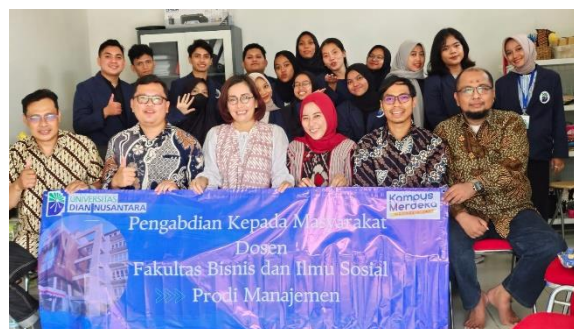
Gambar 3. Sesi Foto Bersama