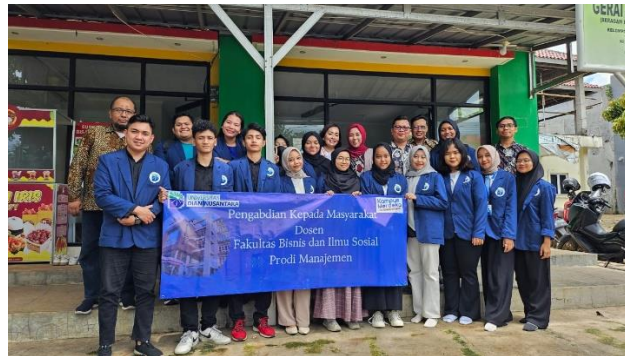
Gambar 1. Tim Pengabdian Kepada Masyarakat

Dalam mengevaluasi hasil yang dicapai dalam pengabdian ini, tim akan melakukan monitoring ke Pegawai dan masyarakat Kabupaten Bogor setelah melaksanakan pengabdian. Selain itu tim pengabdian juga melakukan penyebaran kuisioner kepada peserta pengabdian. Rencananya pengabdian kepada masyarakat ini akan dilaksanakan pada hari Jumat, Sabtu, Minggu 03-05 Maret 2023 jam 9 pagi di Bumdes Kabupaten Bogor.