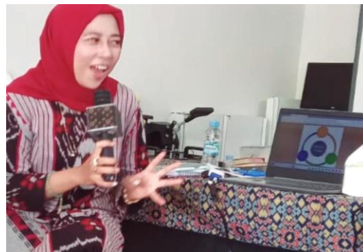
Gambar 2. Kegiatan Abdimas