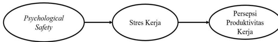
Gambar 1. Kerangka berpikir penelitian